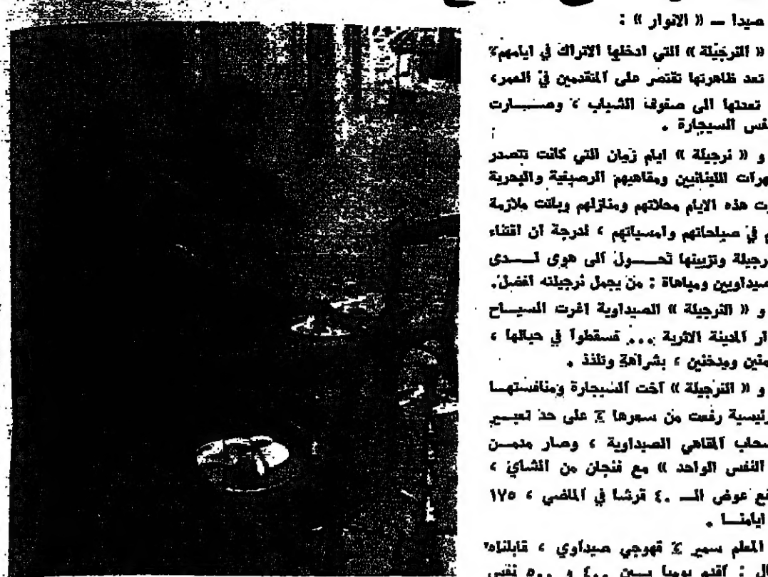
الشباب الصيداوي بيعت الروح في نرجيلة الاتراك